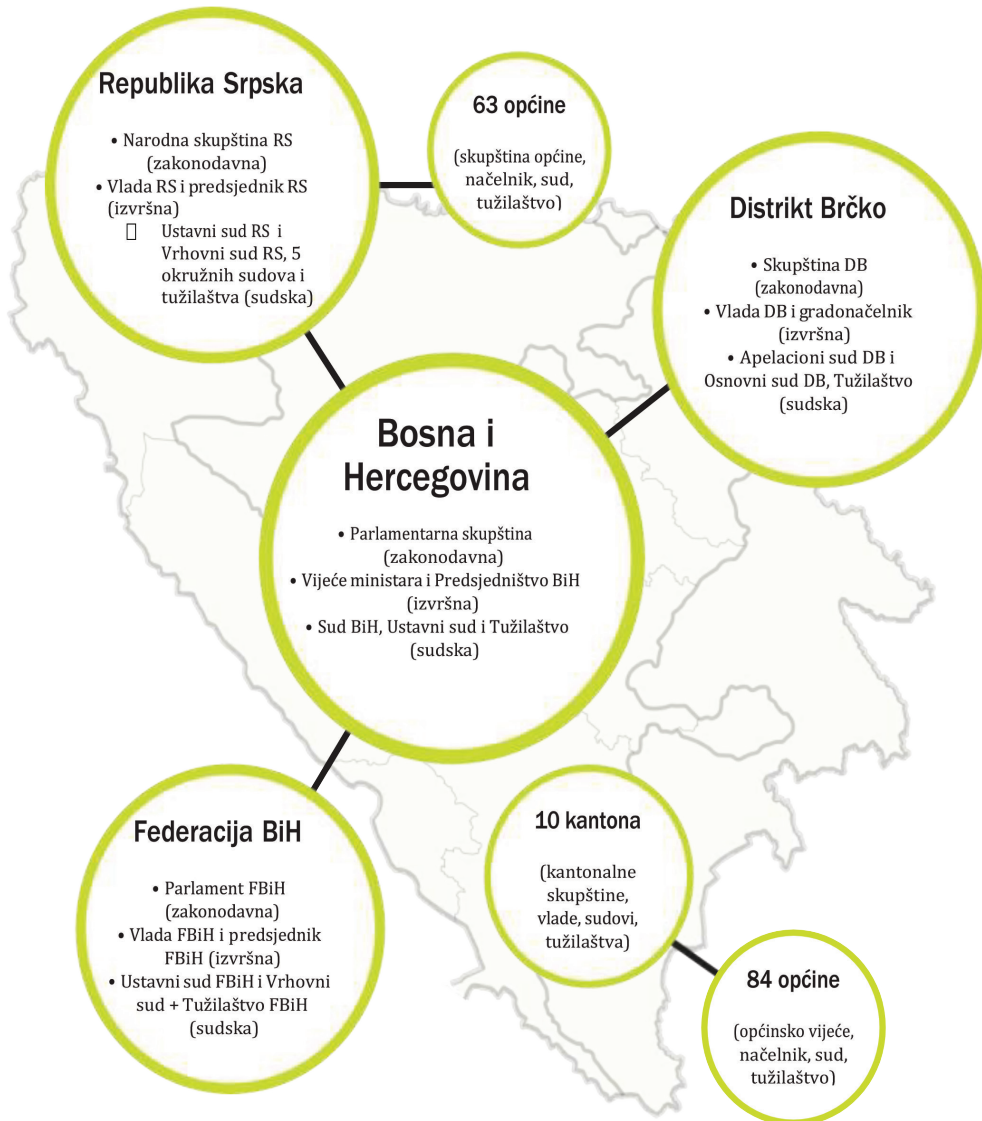
Slika 3. Prikaz zakonodavne, izvršne i sudske vlasti u BiH 21